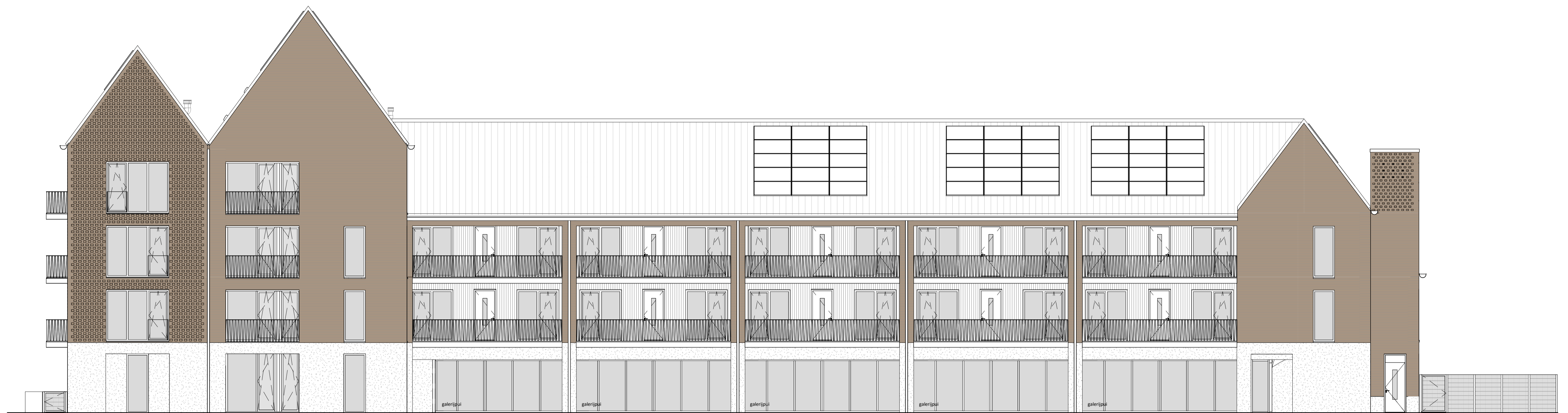
voorgevel - noord-oostgevel