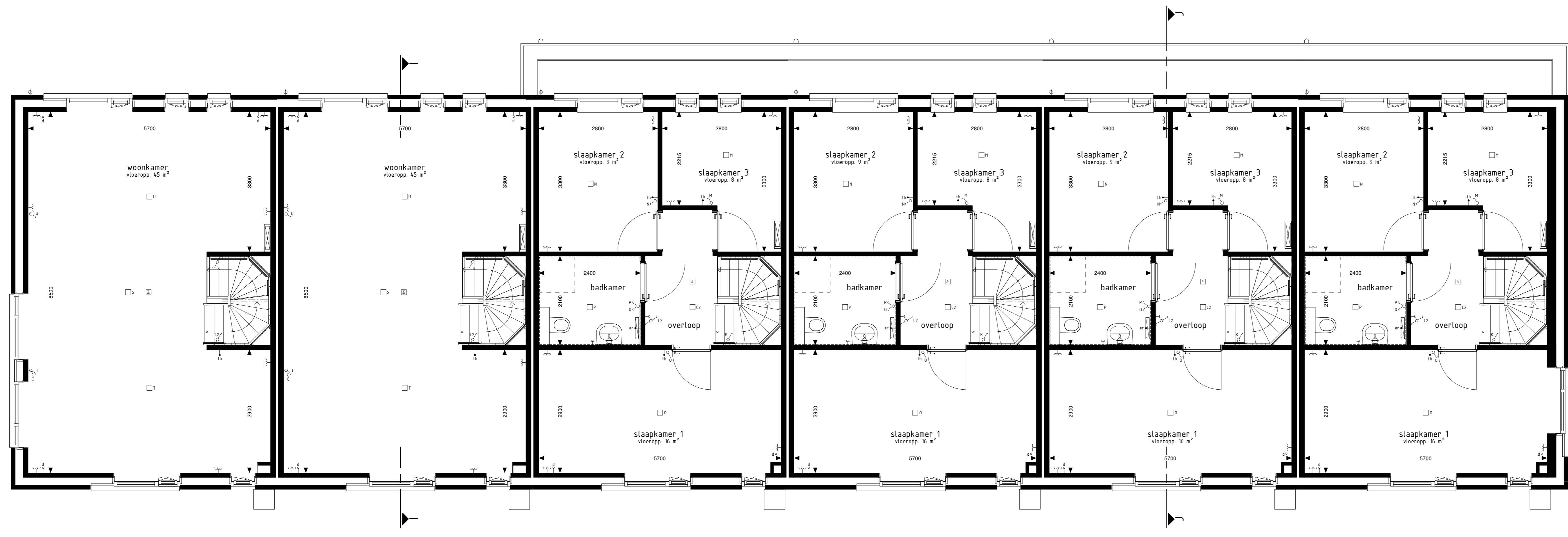
type H bwnr get.:41 type I bwnr get.:42 type J bwnr get.:43 type J bwnr get.:44 type J bwnr get.:45 type K bwnr get.:46 1e VERDIEPING 150