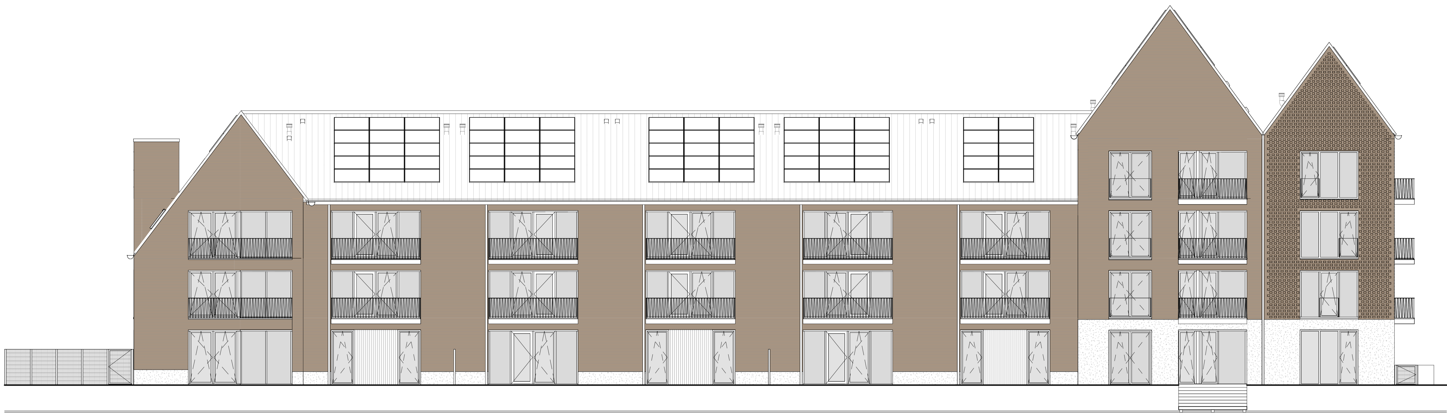
achtergevel - zuid-westgevel