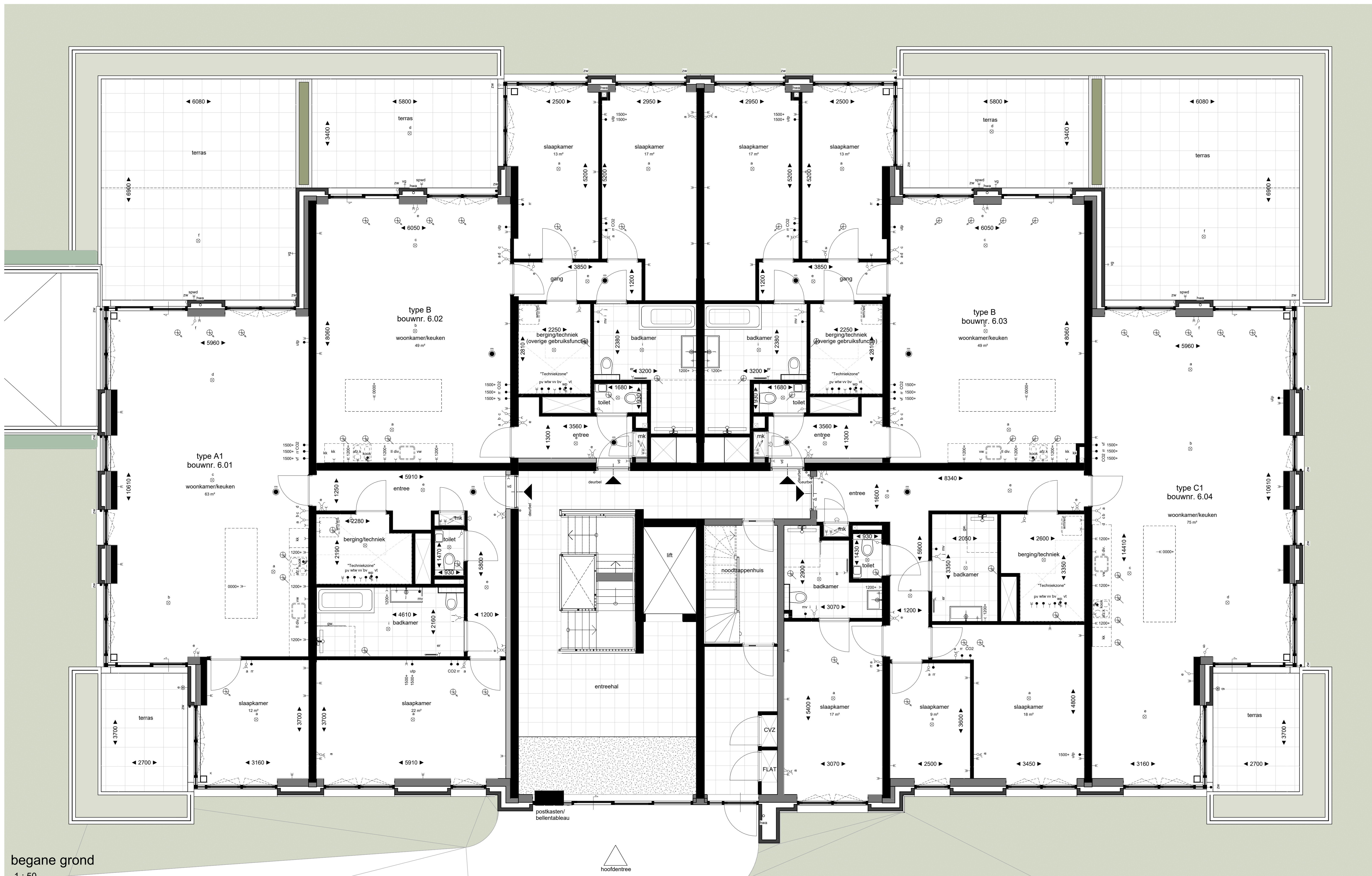
begane grond 1 : 50